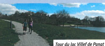
Tour du lac Villefranche de Panat