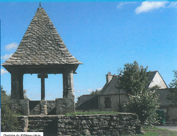
Oratoire du XVIIème siècle