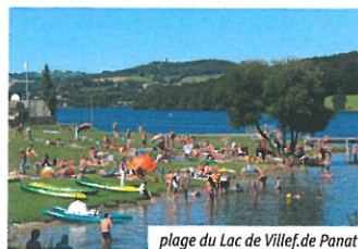
plage du Lac de Villefranche de Panat

Depuis les années 50, avec la création du barrage, les destins de Villefranche-de-Panat et d'Alrance semblent enfin se confondre. Grâce à la mise en eau du lac, ses berges, leurs espaces verts aménagés, leur